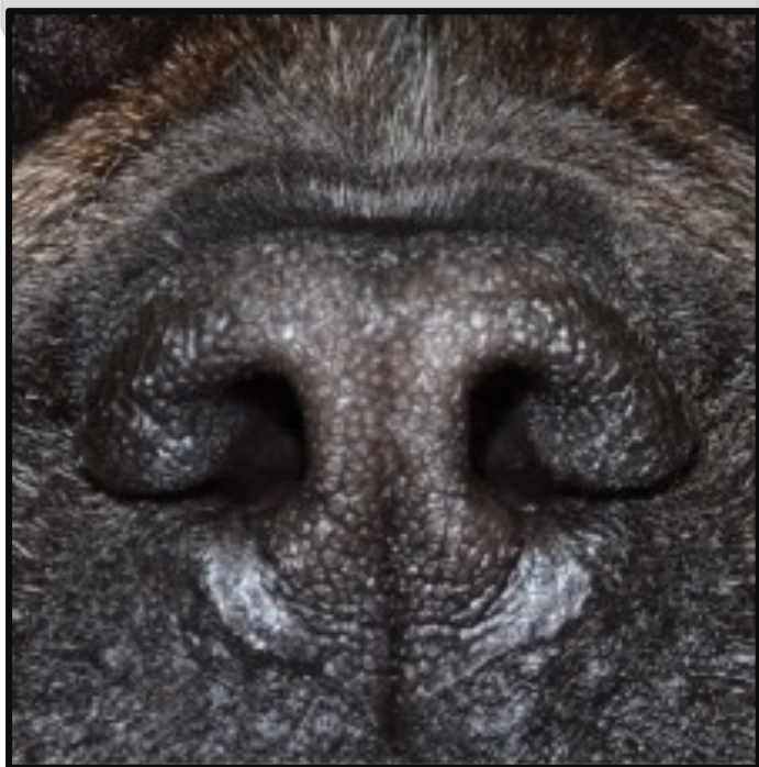
0 – Otevřené