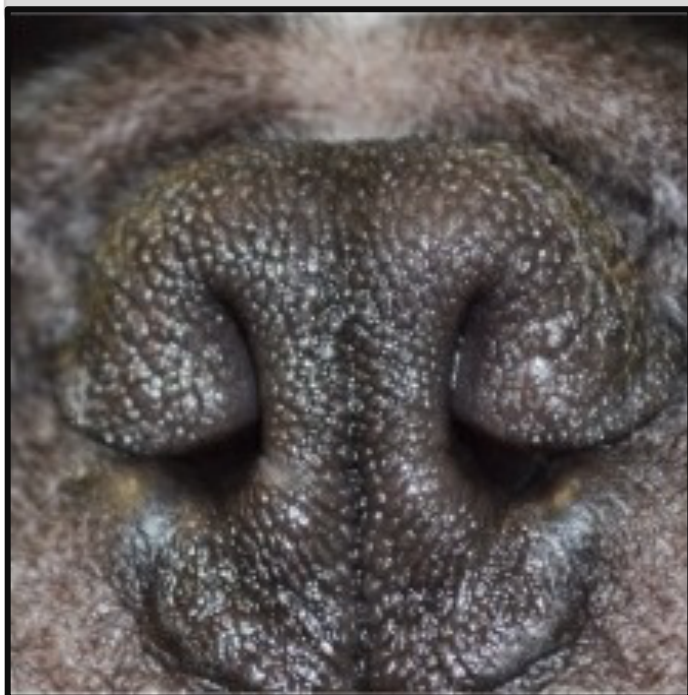
2 – Mírně zúžené